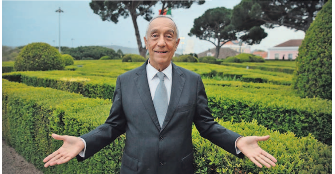
El presidente de Portugal recibe el Premio en su 60.ª edición. Le será entregado en una ceremonia en el último trimestre del año. MARCOS MÍGUEZ

Constituyeron el jurado las siguientes personas: Santiago Rey Fernández-Latorre, presidente de la Fundación; Rober-