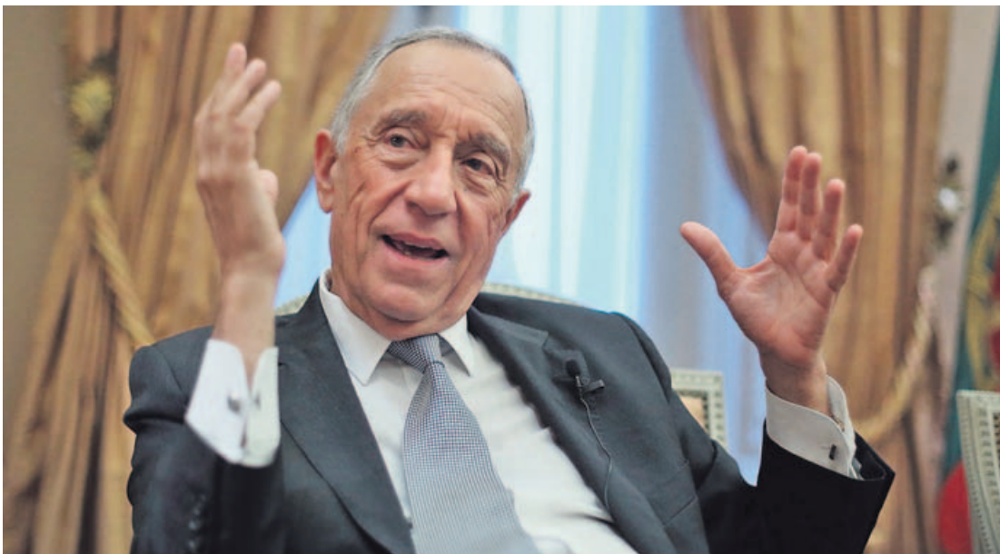
El presidente Marcelo Rebelo de Sousa se define como un hombre «optimista, luchador, persistente, trabajador y muy activo».